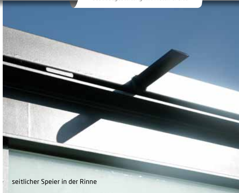
seitlicher Speier in der Rinne