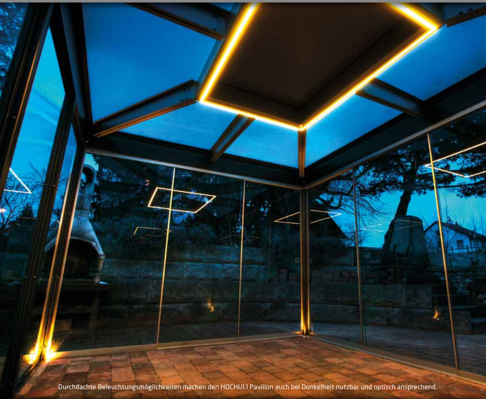
Durchdachte Beleuchtungsmöglichkeiten machen den HOCHULI Pavillon auch bei Dunkelheit nutzbar und optisch ansprechend.