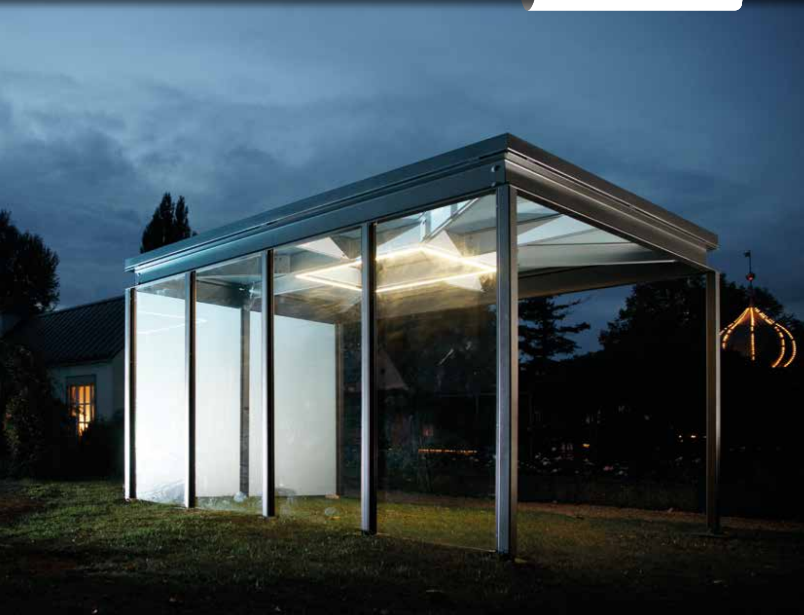
Das LED-Lichtband zur stimmungsvollen Beleuchtung.