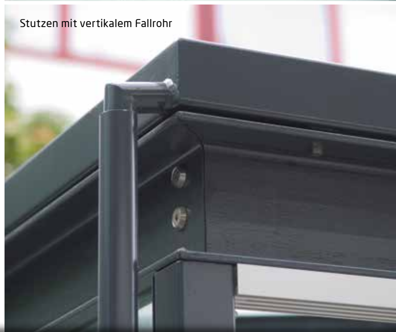
Stützen mit vertikalem Fallrohr